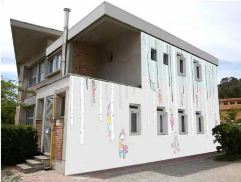
Fotoinserimento n° 1